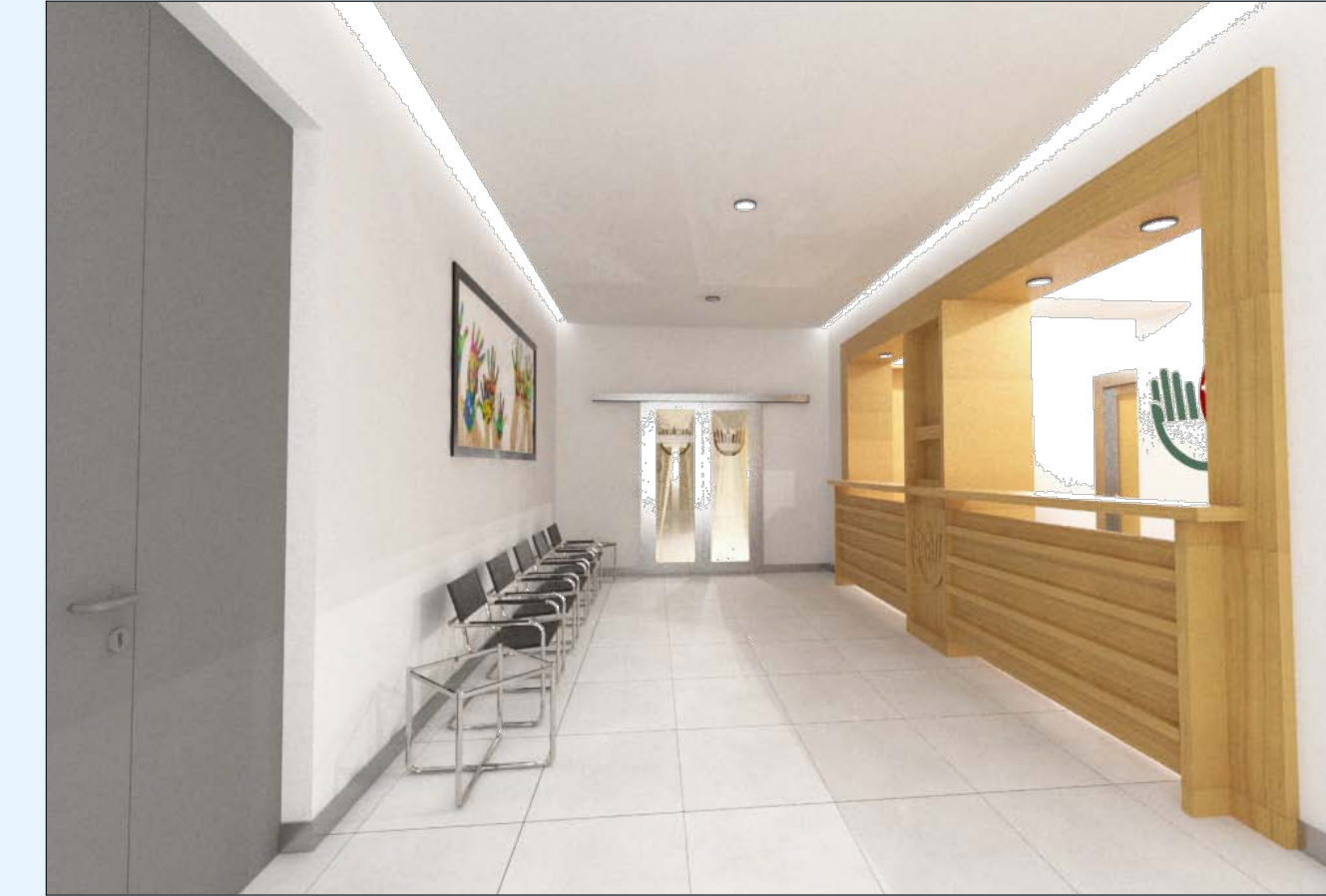
"Viste Prospettiche zona Hall e Accettazione"