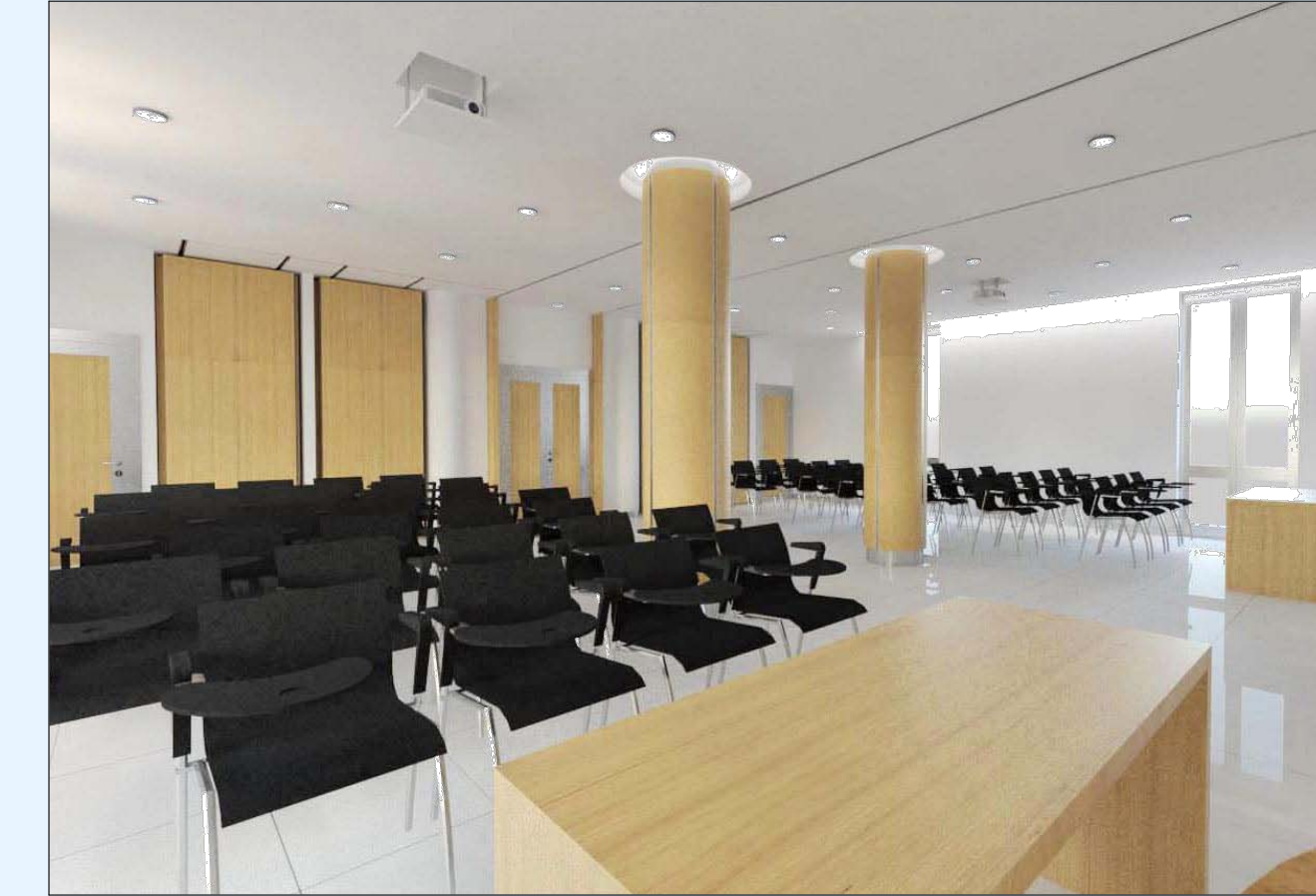
"Viste Prospettiche zona Sala Corsi di Formazione"